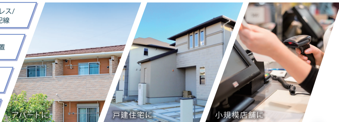
固定焦点ドーム型