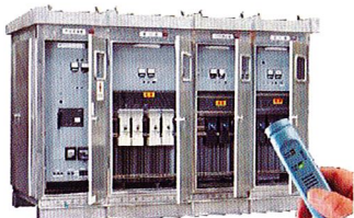
キュービクル絶縁不良チェック

リーケージ・チェッカーは、電力機器の絶縁不良時に発生する40kHzの超音波を検知すると可聴音へ変換し、50dB(要観察・再測定)70dB(要精密点検)の音圧をLED表示でお知らせします。