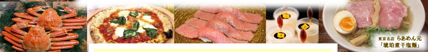
東京名店 らあめん元 「琥珀煮干塩麺」