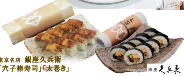
東京名店 銀座久兵衛 「穴子棒寿司」「太巻き」