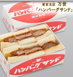
東京名店 万世 「ハンバーグサンド」

銀座久兵衛「穴子棒寿司」「太巻き」、たいめいけん「オムライス」、肉の匠 将泰庵の「飲めるハンバーグ」等、東京を代表する名店が集結。その他全国各地のご当地グルメもご用意しております。