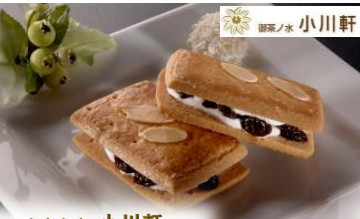
東京名店 小川軒 「レイズンウィッチ」

銀座久兵衛「穴子棒寿司」「太巻き」、たいめいけん「オムライス」、肉の匠 将泰庵の「飲めるハンバーグ」等、東京を代表する名店が集結。その他全国各地のご当地グルメもご用意しております。