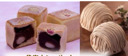
東京名店 代官山シェ・リュイ 「代官山あんぱん」「モンブランマロン」