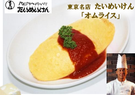
東京名店 たいめいけん 「オムライス」