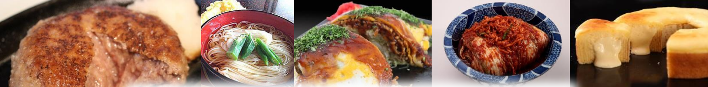
東京名店 肉の匠 将泰庵 「飲めるハンバーグ」