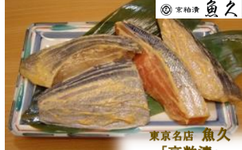
東京名店 魚久 「京柏漬」