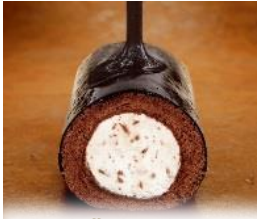
東京名店 お菓子工房SHIMIZU 「ベルギーロール」